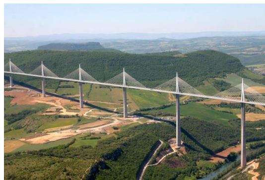
Viaduc de Millau

Paysages : Chaîne des Pyrénées, Vallée de la Garonne, plage de Méditerranée