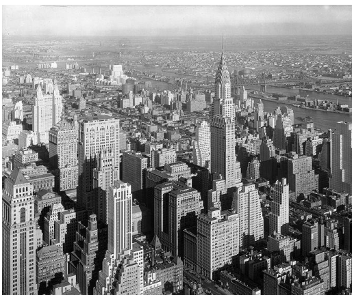
Le Chrysler Building en 1932

L'architecte a obtenu de Walter Chrysler, désireux de posséder le plus haut bâtiment au monde, la permission de construire une flèche de 58,4 mètres, qui avait été assemblée à l'intérieur même du bâtiment. La flèche de 27 tonnes, composée d'acier inoxydable, fut hissée au sommet du gratte-ciel, en 90 minutes, faisant du Chrysler Building non seulement le plus haut bâtiment au monde, mais aussi la plus haute structure jamais construite, devant la tour Eiffel.