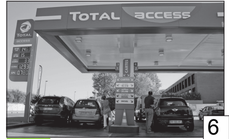
Doc. 3 Une station essence à Lyon.