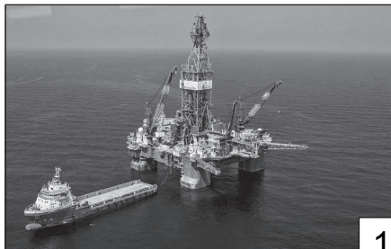
Doc. 5 Un gisement off-shore en Afrique.