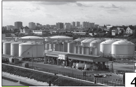
Doc. 2 Un dépôt pétrolier à Gennevilliers.