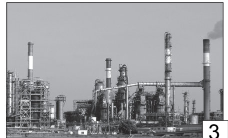
Doc. 6 Une raffinerie à Donges (Pays-de-la-Loire).