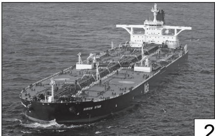
Doc. 4 Un tanker sur l'océan Atlantique.