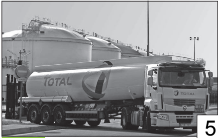
Doc. 1 Un camion-citerne à la sortie du dépôt pétrolier de Gennevilliers.