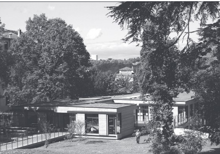
Doc. 1 Le centre de loisirs Caluire Juniors à Caluire-et-Cuire.

Je découvre comment un bâtiment municipal peut s'intégrer à la nature.