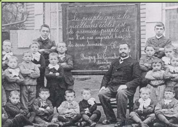
Photo d'une classe Jules Ferry.