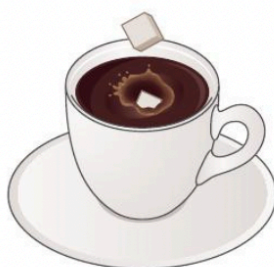
Dissolution du sucre dans une boisson