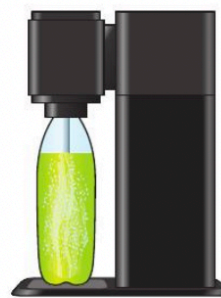
Eau pétillante obtenue par injection de gaz dans de l'eau plate