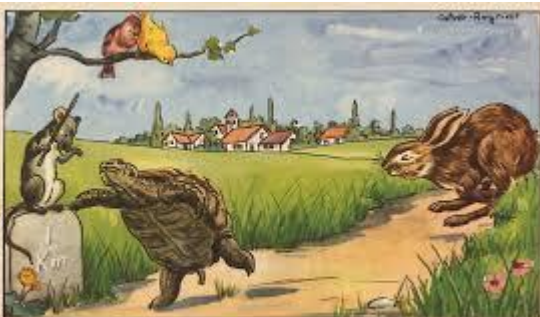
le lièvre et la tortue