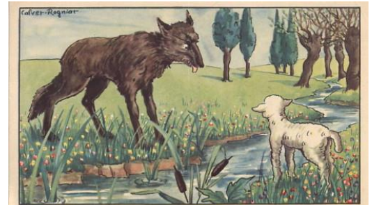
le loup et l'agneau