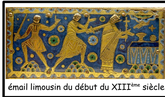
émail limousin du début du XIII ème siècle

Un émail peint est une matière vitreuse colorée à l'aide d'oxydes métalliques. Spécialité de la ville de Limoges depuis le Moyen-Âge, l'émail est à l'origine une peinture disposée dans des motifs constitués de cloisons métalliques correspondant à chaque couleur. L'émail peint, lui, n'a pas besoin de ses cloisons. On pose les couleurs sur une plaque de cuivre après les avoir mélangées avec une matière grasse pour les faire adhérer à la surface métallique. La matière vitreuse doit être cuite pour durcir. Elle ne sèche pas comme un tableau. La plaque subit une cuisson par couleur car chaque teinte nécessite une température propre.