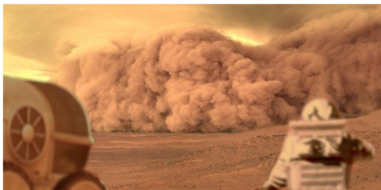
Twentieth Century Fox : The martian – Seul sur Mars