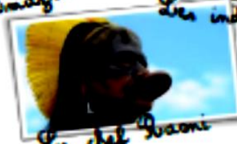
Le chef Saoni