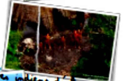
Les indiens d'Amazonie