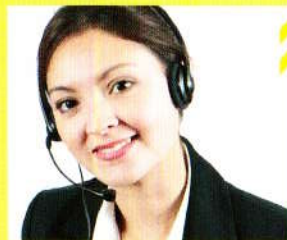
PLATE-FORME SERVICES CLIENTS ET NUMÉRO D'URGENCE