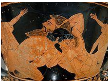
Héraclès et Hanté (515 – 510 av JC)

La lutte est une discipline sportive et un sport de combat depuis des millénaires.