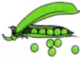
des petits pois