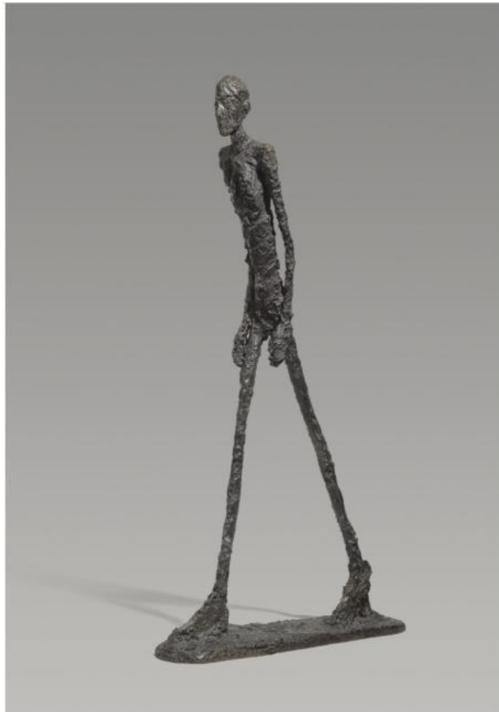
Homme qui marche (1960)