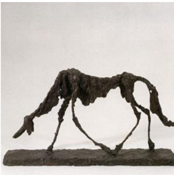
Le chien , 1951

sculpture en bronze, (46 x 98,5 x 15 cm)