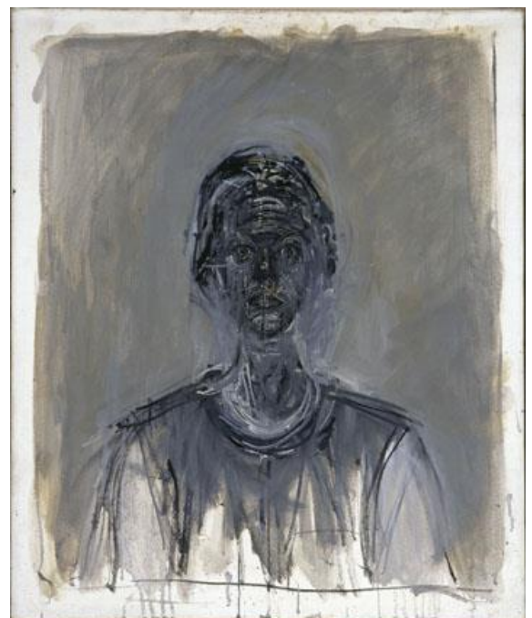
Annette , 1962

sculpture en bronze, (46 x 98,5 x 15 cm)