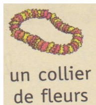
un collier de fleurs