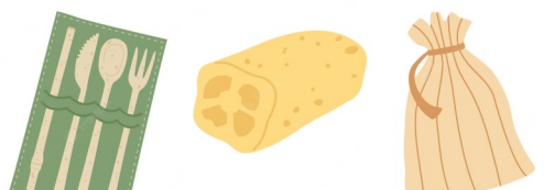
Éviter les plastiques à usage unique