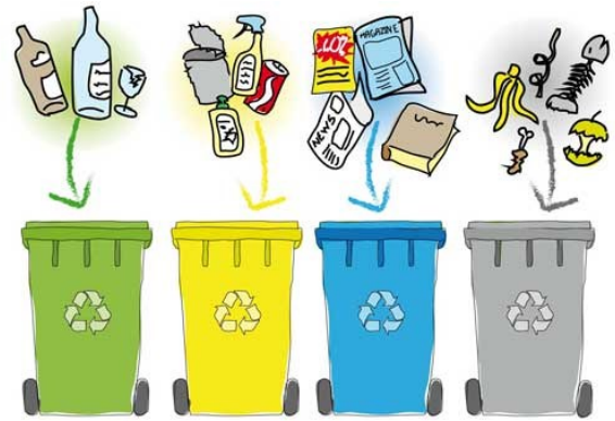
Trier les déchets et recycler