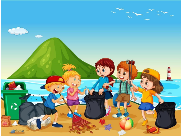
Nettoyer les plages

Que pouvons-nous faire pour protéger les océans ?