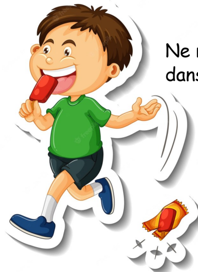
Ne rien jeter dans la nature