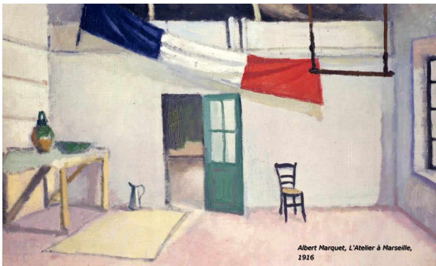
Albert Marquet, L'Atelier à Marseille , 1916

Pas de culture française! Pas de drapeau français! Pas de soldat inconnu! Pas de réel défilé!