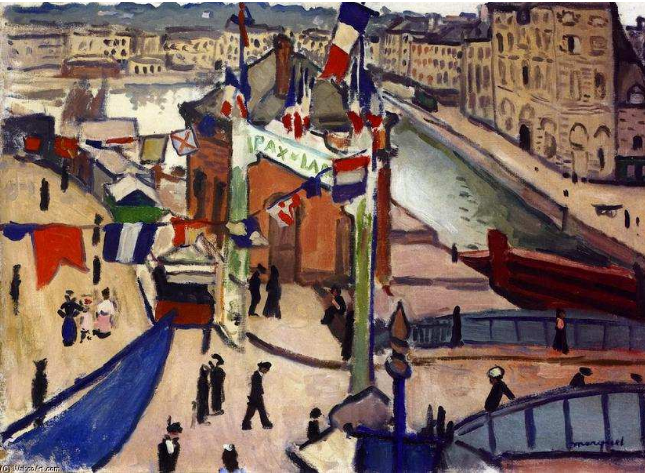
La Fête nationale au Havre, Albert Marquet, 1906

« Moi, l'art français, je ne l'ai jamais vu », avait répété le candidat Macron quinze jours plus tard à Londres. Chaque Français pourra donc se « réinventer » avec le Président et ce d'autant plus aisément qu'il n'y a aucun art français dans cet empaquetage. Il n'y a même aucun art. Tout juste une manie de lilliputien rêvant de déménager les appartements de Gulliver.