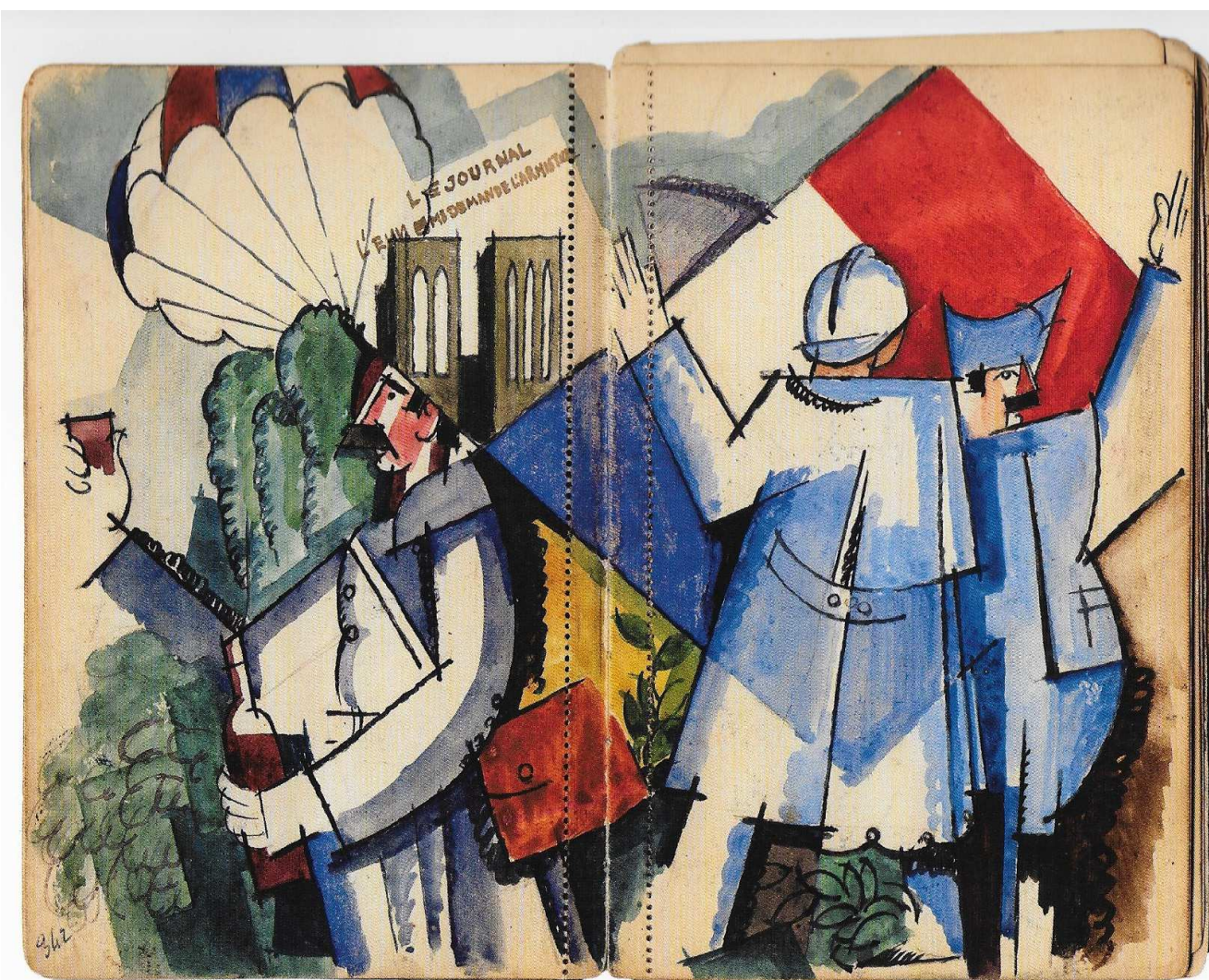
André Mare, L'Armistice 1918, carnet de guerre

Si, quittant les sentiers battus de la puérilité et de ce que l'on pourrait appeler le « contresens culturel par lâcheté », nos gouvernants avaient le souci de renforcer l'unité du pays par de grandes manifestations ne s'adressant ni à des individus ni à des consommateurs mais à des citoyens français fiers de ce que leur pays a apporté au monde, si la nouvelle ministre en charge des affaires culturelles avait l'ambition de renouer avec une certaine idée de la culture française et l'imagination de la partager avec un public le plus large possible, alors nous pourrions peut-être commencer de dire que la France est de retour.