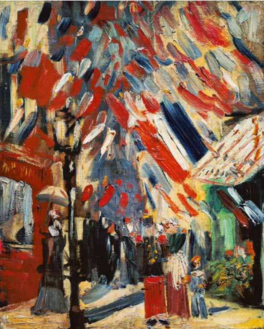
Vincent Van Gogh, 1886

Pour Monet et ses amis, la distance avec le réel en dehors de laquelle il n'y a pas de création n'était ni celle des grands arts religieux depuis Sumer, ni celle, moins évidente, du rêve somptueux qui enivra l'Italie de Florence à Venise. Cette distance avec le réel était celle d'une peinture qui se voulait autonome, toute entière tendue vers ce que Georges Braque appellera le « fait pictural ». D'où la querelle, l'une des plus importantes de l'histoire de l'art, entre les Indépendants et les Officiels dont la virtuosité « photographique » au service de l'histoire et de la mythologie arracha ces mots à Cézanne : « Horriblement ressemblant ! ».