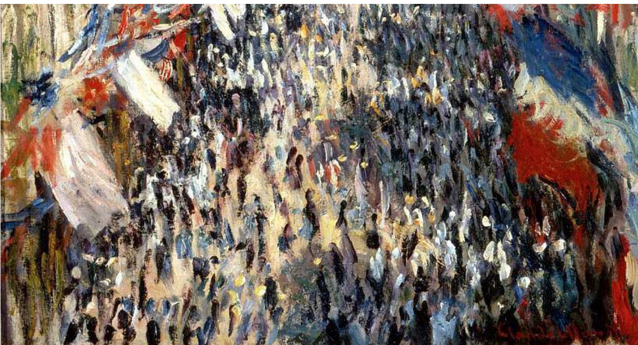
La rue Montorgueil, Monet 1878