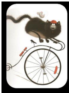
Une course de vélo