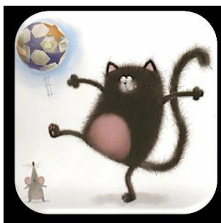
Un match de football