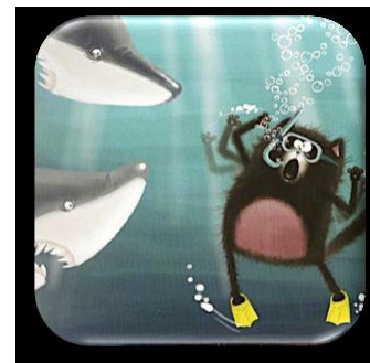
La plongée avec les requins