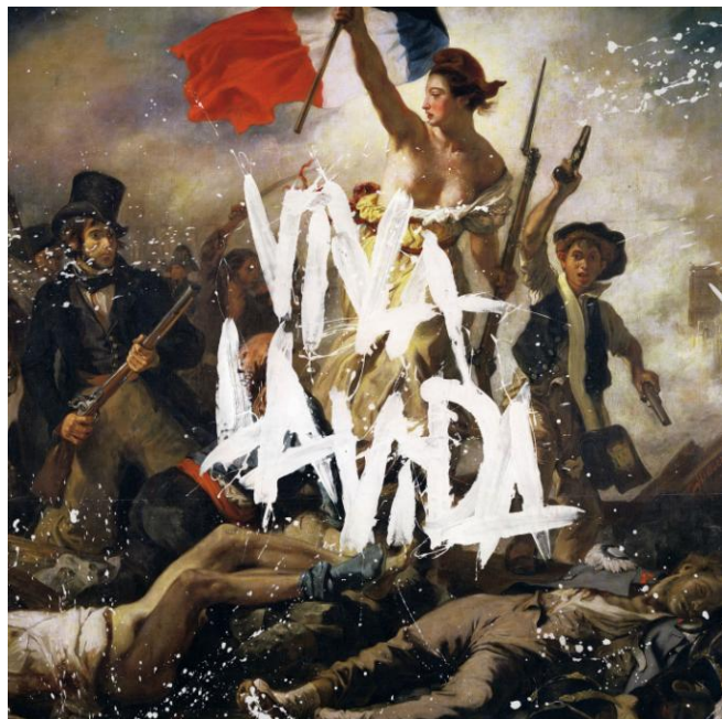
une pochette de disque de Coldplay