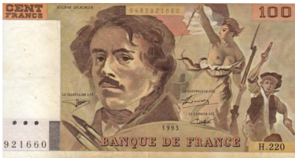
le billet de 100 francs