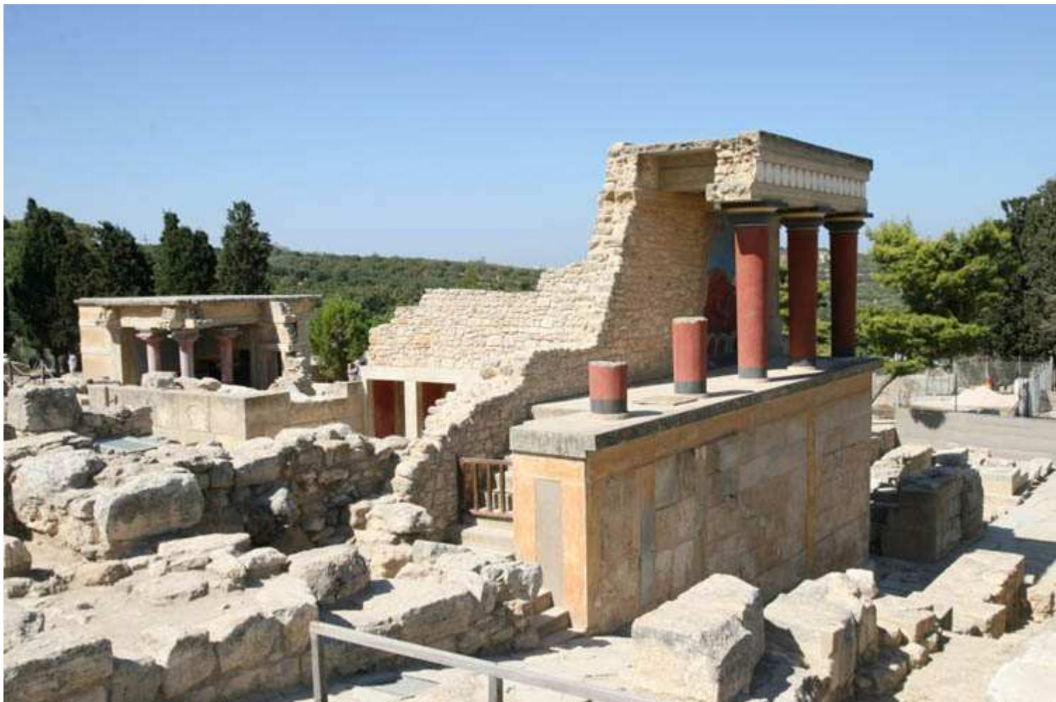
Palais de Minos à Knossos