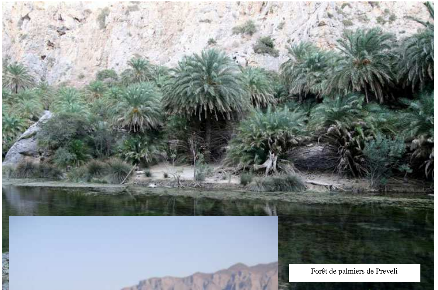
Forêt de palmiers de Preveli