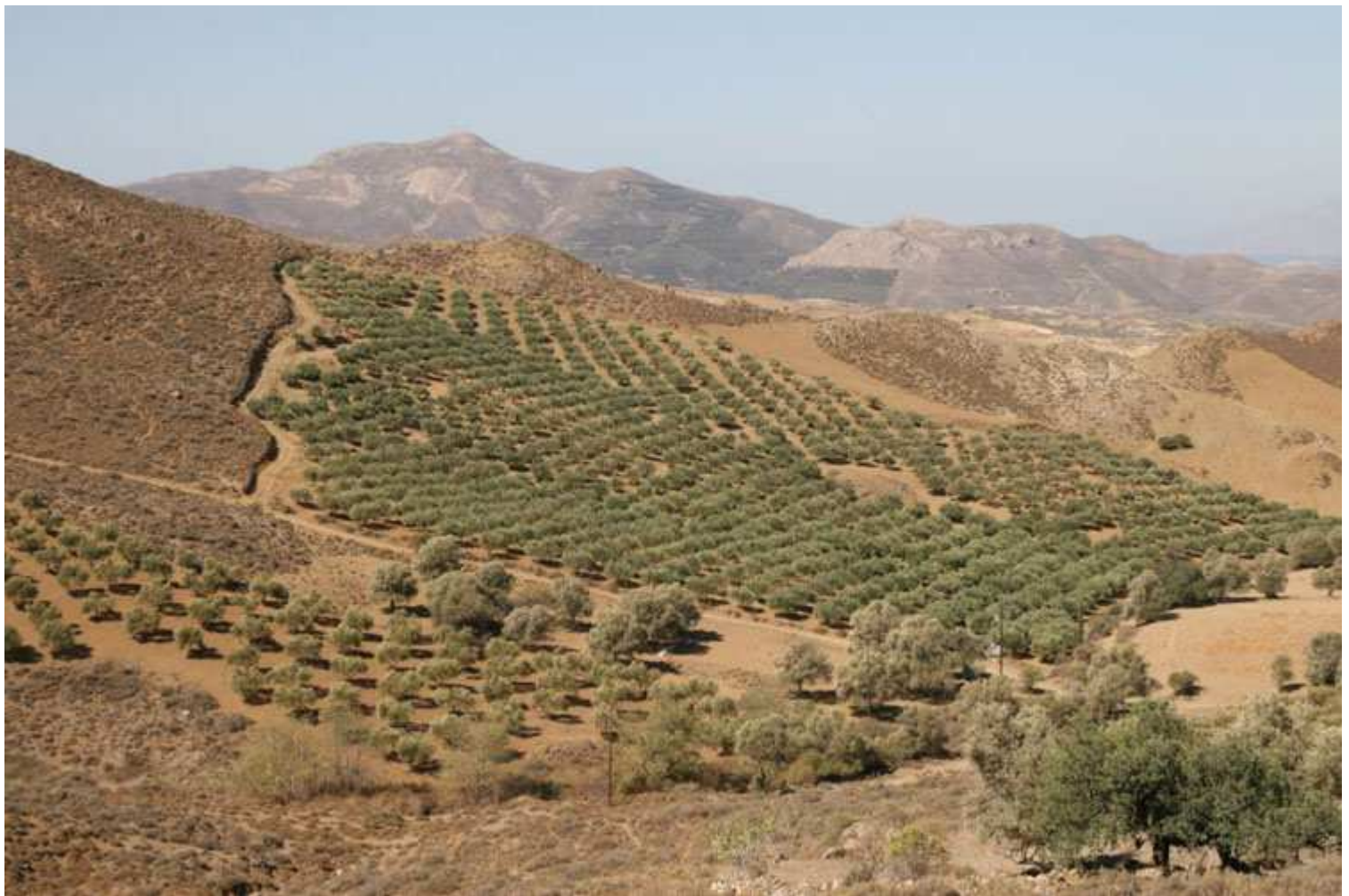
Sud de la Crète