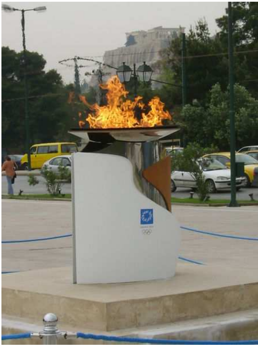
Flamme olympique 2004 et parthénon