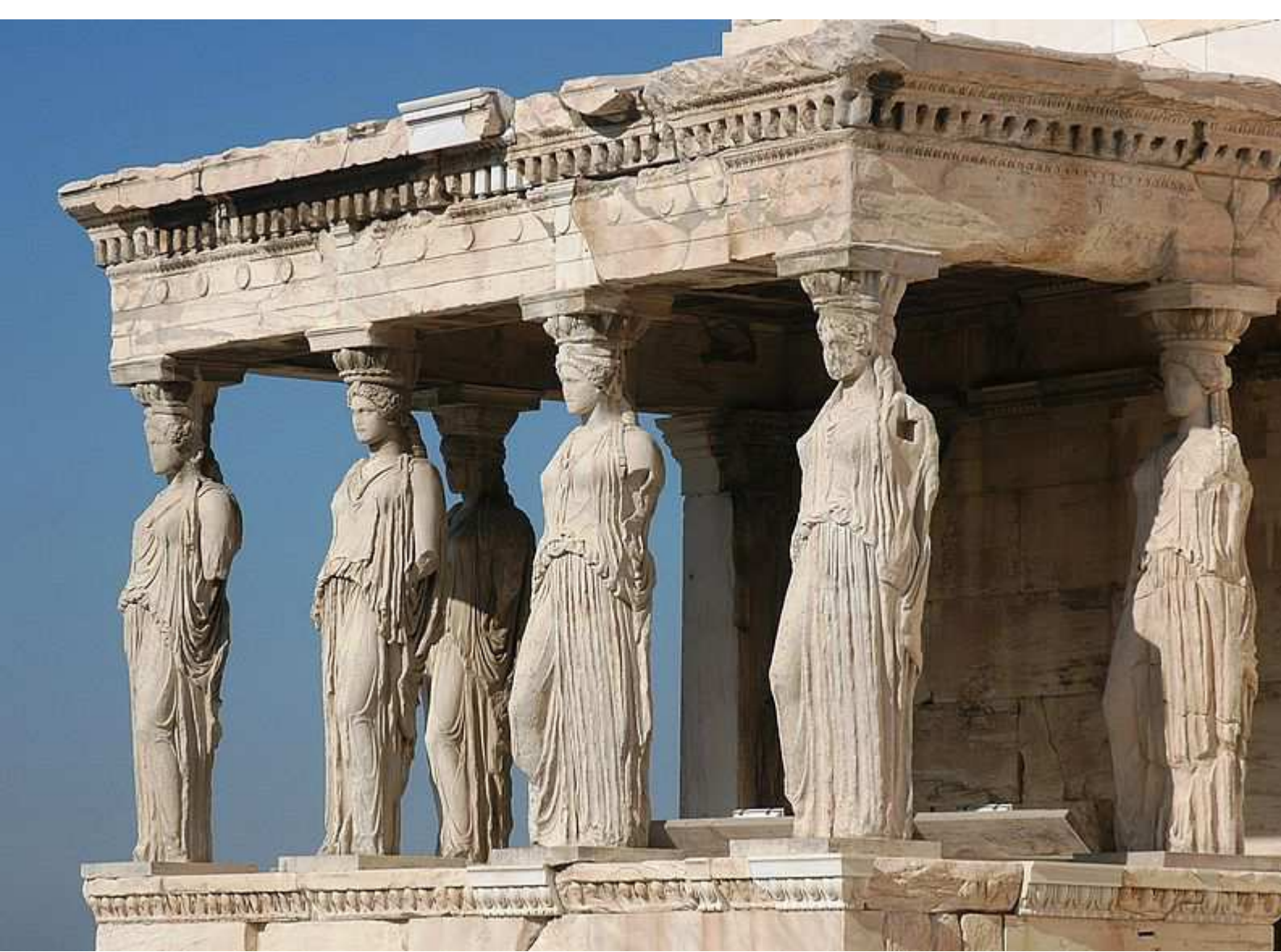
Les Cariatides de l' Érechthéion sur l'Acropole.