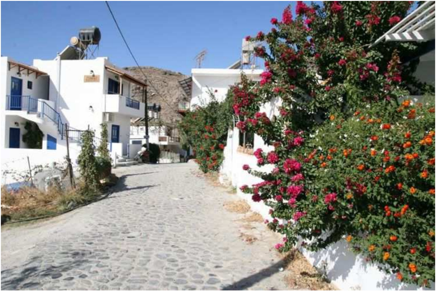
Lentas sud de la Crète