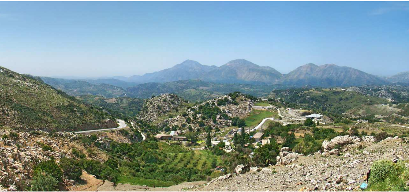
Paysage de Crète intérieure dans les environs d'Anogia