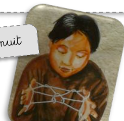
Loisir d'enfant Inuit

Traditionnellement, ce sont les hommes qui chassent et les femmes qui réalisent les travaux de couture.