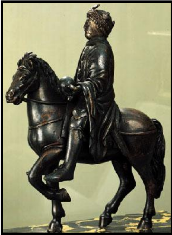
Doc.1: Statue équestre de Charlemagne (IX ème siècle)