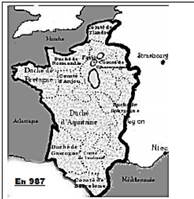
Doc.5: Cartes de l'évolution du royaume de France au Moyen Age