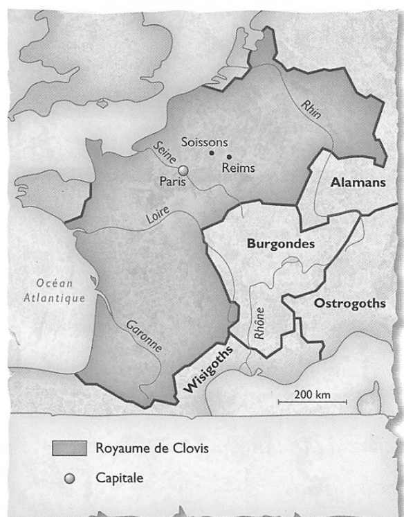
Doc. 2 La Gaule en 511, à la mort de Clovis.

Premier roi de France, Clovis meurt en 511. Ses quatre fils se partagent son royaume mais très vite ils se font la guerre pour étendre leurs territoires. Les successeurs de Clovis forment la dynastie des Mérovingiens .