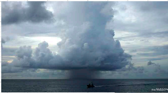
Le « pot au noir »