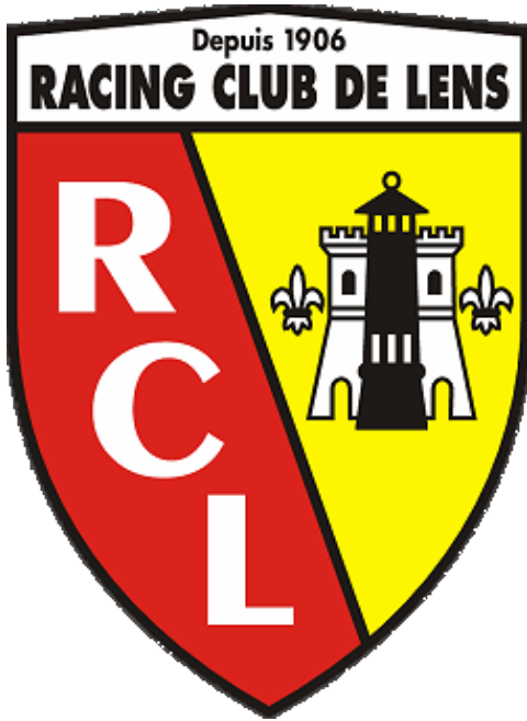
Document 1 : blason du Racing Club de Lens.

Le club est devenu celui de toute une ville et saisit chaque occasion pour redorer son blason. Les footballeurs investissent le stade Léo Lagrange. C'est un grand luxe : un vrai stade avec des vestiaires et une tribune et plus tard seront rénovés les clôtures et une buvette.