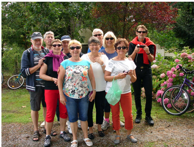
Villas anciennes - 16 août 2014

▶ Découvrir les villas anciennes et l'histoire de Stella. En famille, à vélo et en prenant le temps.