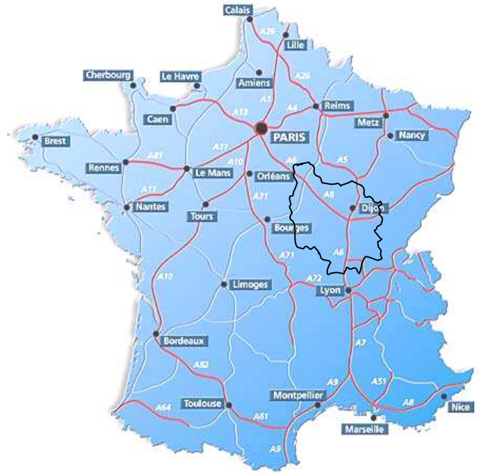
Autoroutes de France