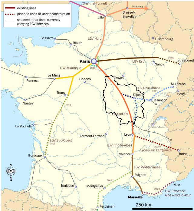
Voies de chemin de fer à grande vitesse