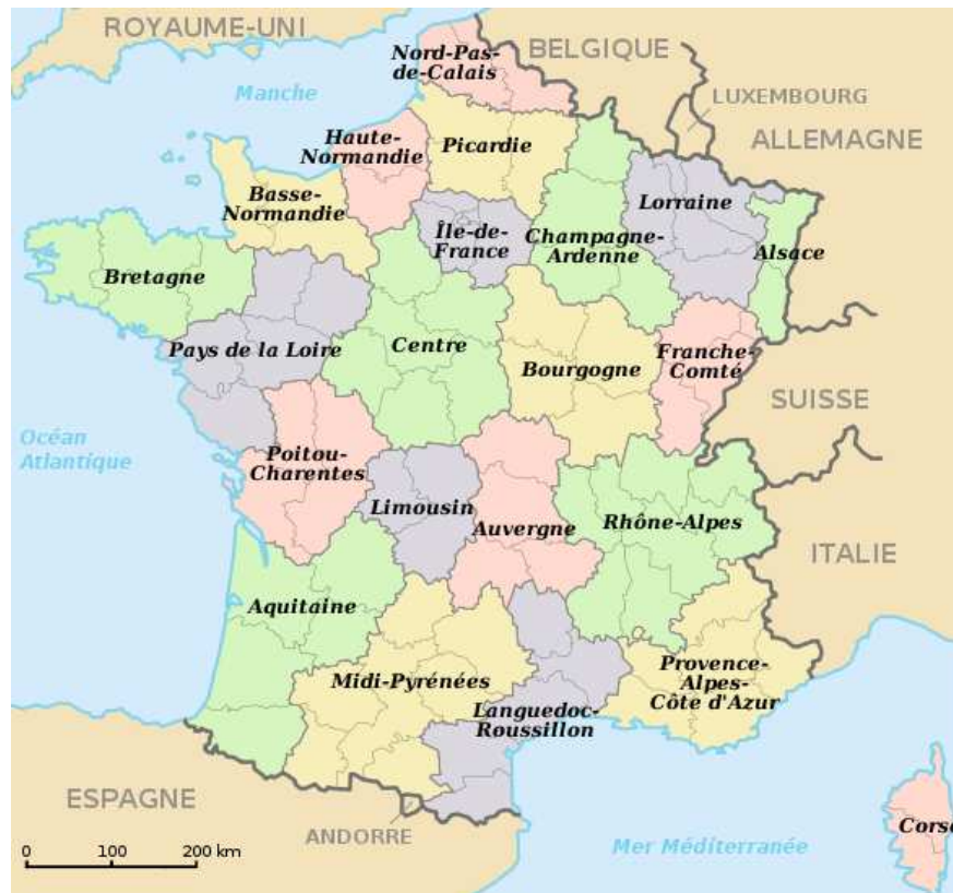
Le découpage de la France en régions modernes date de 1956.