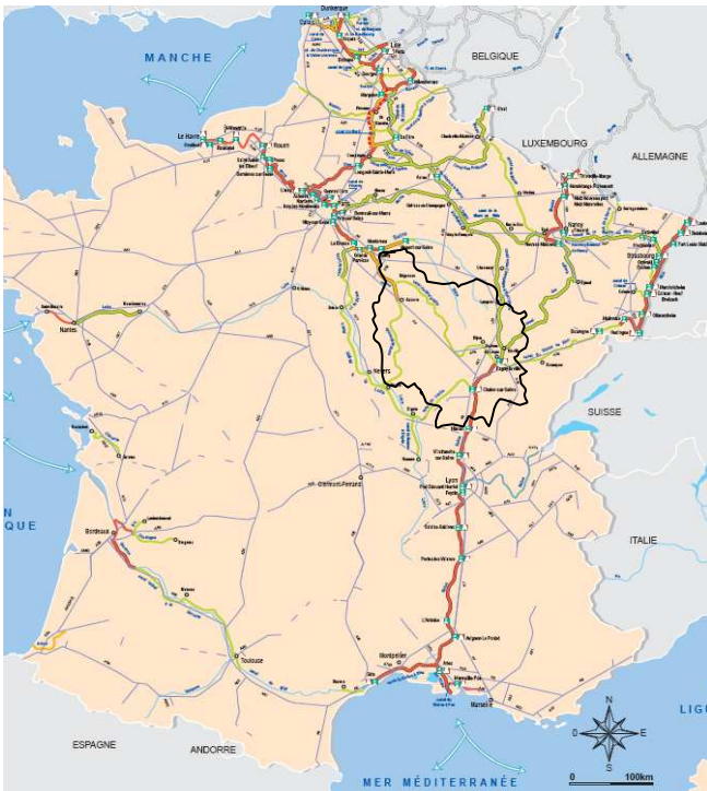
Voies fluviales de France

1- Repasse en rouge les lignes de chemin de fer à grande vitesse qui traversent la Bourgogne.