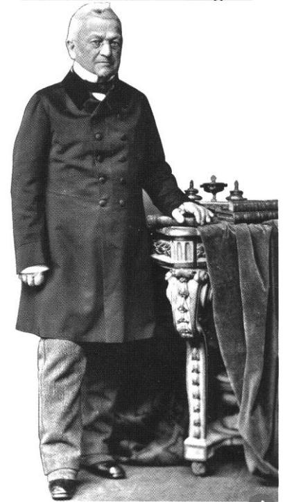
Adolphe Thiers, premier président de la III e République.