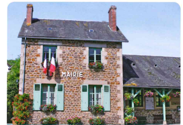
Mairie de village