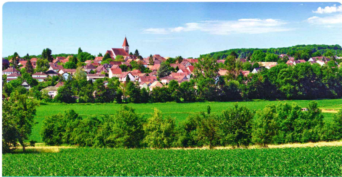
Village de Zimmersheim en Alsace

Les villages sont souvent construits autour d'une église. On y trouve deux sortes d'habitats : dans le centre du bourg, des maisons individuelles souvent anciennes et collées les unes aux autres ; autour du bourg, des lotissements construits par la suite. Il existe aussi un habitat dispersé, composé de fermes ou de hameaux éloignés du bourg .