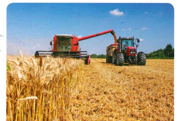
Champs de blé pendant la moisson