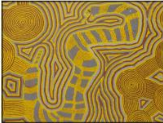
Le rêve du serpent