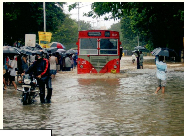
Doc B : La mousson en Inde

La mousson estivale donne quatre-vingt pour cent du total de précipitations. La mousson est à la fois bienfaisante puisqu'elle irrigue les terres et malfaisante lorsqu'elle noie les villages. Elle est irrégulière comme l'avenir est imprévisible. L'agriculture en Inde, qui représente soixante-dix pour cent des emplois, dépend donc de la mousson. Des cultures comme le coton, le riz, ... ont de fortes demandes en eau. Une faible mousson, ou une arrivée tardive de celle-ci, prennent un tour dramatique pour des centaines de millions d'Indiens et de Bangladais dont la vie économique est intégralement suspendue à l'apport de ces pluies de mousson 1 . Durant les années 1990, des sécheresses causées par un changement de patron de la mousson ont causé des dégâts humanitaires et financiers importants.