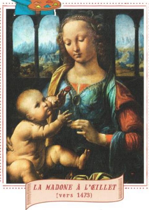
LA MADONE À L'ŒILLET (vers 1473)