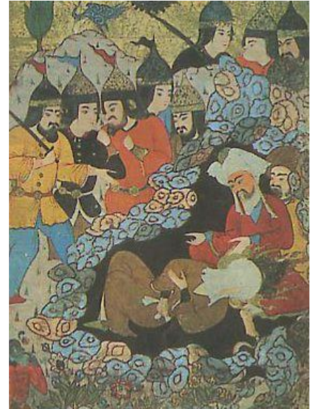
Doc C : Mahomet dans la grotte du mont Hira