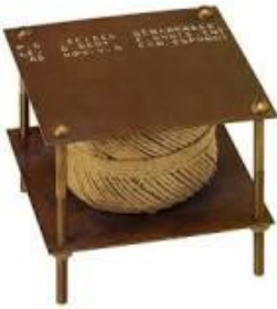
A bruit secret