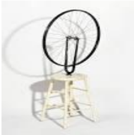
Roue de vélo