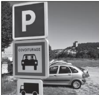
Station de covoiturage

15) Quelles solutions permettent de remédier à ces inconvénients ? Complète la légende des photographies pour répondre à cette question.