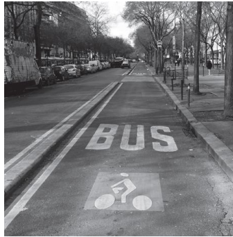
Voie de bus et piste cyclable