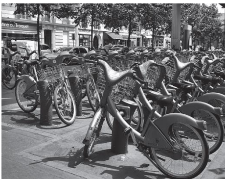
Vélos en libre-service