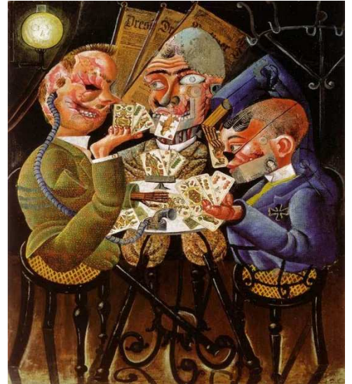
Les joueurs de Skat, Otto Dix, 1920