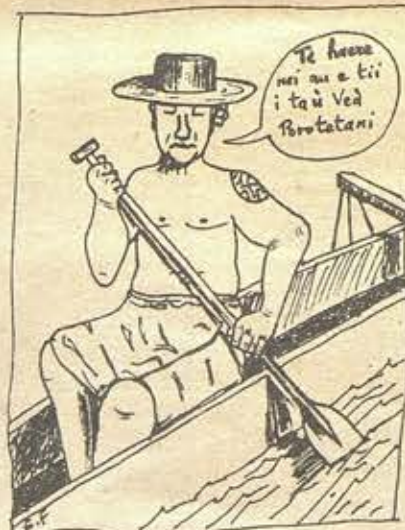
Dessin : Eric Ferret