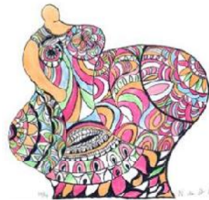
Niki de Saint Phalle, nana Pomme