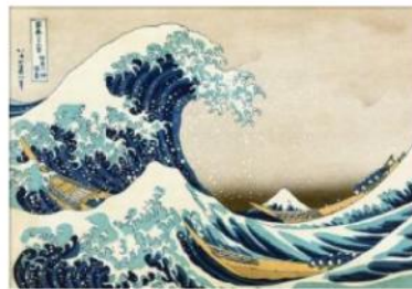
Hokusai, La grande vague de Kanagawa.