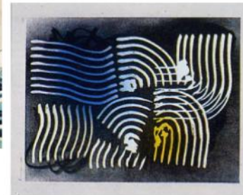
Hans Hartung, Farandole 18, 1971.