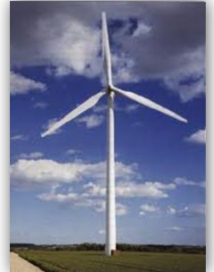
Panneaux solaires, éolienne