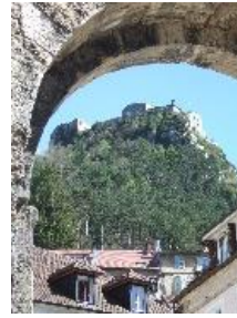
Salins-les-Bains : Dôme Chapelle Notre-Dame - Fort Belin

Un grand merci à tous les bénévoles et partenaires qui s'unissent pour que cette manifestation se déroule dans les meilleures conditions !