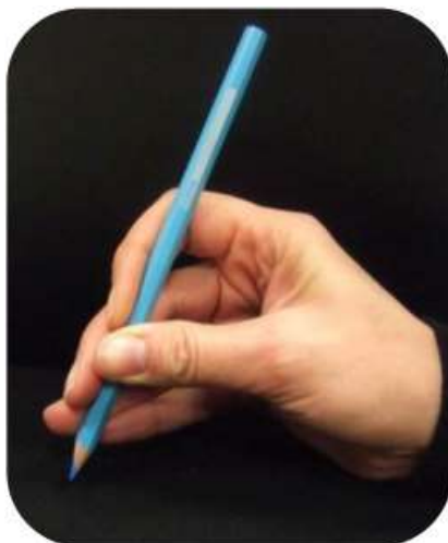
Tous les doigts au dessus et le pouce en opposition