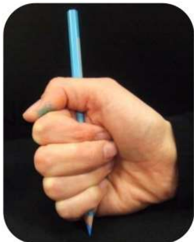
Crayon tenu par tous les doigts