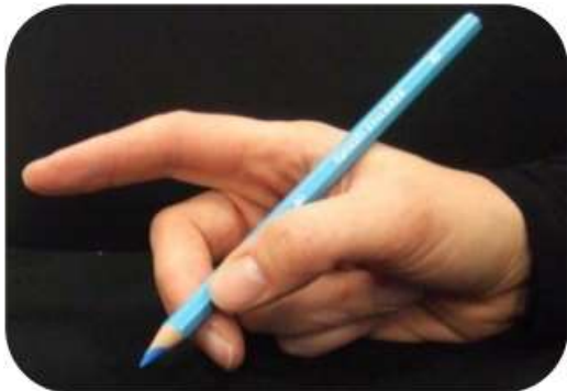
Ce n'est pas l'index qui pince, il dirige.

Les doigts ne sont ni trop près, ni trop loin de la mine.