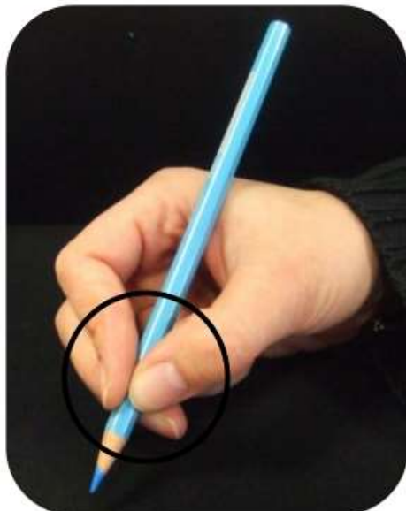
Le crayon est posé sur la première phalange du majeur . Il est coincé entre 3 doigts.