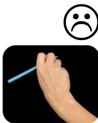
Crayon vers l'extérieur