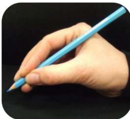
Majeur sur le crayon