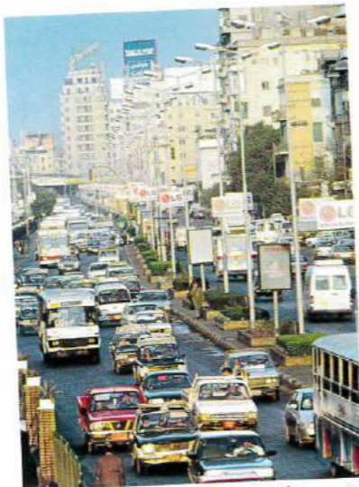
Le Caire (Égypte).

Objectifs : Savoir regrouper des mots selon le sens de leur suffixe et connaître ce sens. Texte en lien : Nelson Mandela, combattant de la liberté, p. 218.