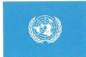
Le drapeau de l'ONU.

Catherine Stern, Le Développement durable à petits pas , © éd. Actes Sud, 2006.