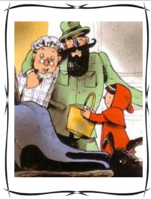
Travail réalisé à partir de la version de Grimm aux éditions Nathan, collection les petits cailloux