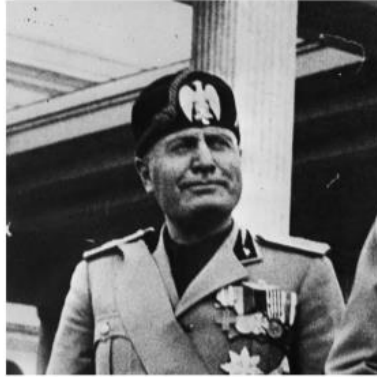
Mussolini en Italie.

Nous connaissons deux des dictateurs au pouvoir en Europe dans les années 1930.