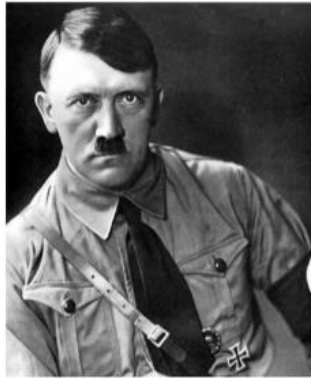
Hitler en Allemagne.