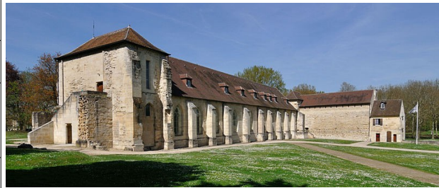
façade sud

Le sujet : L'abbaye Notre-Dame-la-Royale dite « de Maubuisson » est une ancienne abbaye royale cistercienne fondée en 1241 par Blanche de Castille. Elle est située sur la commune de Saint-Ouen-l'Aumône, non loin du château de Pontoise, dans le Val-d'Oise.