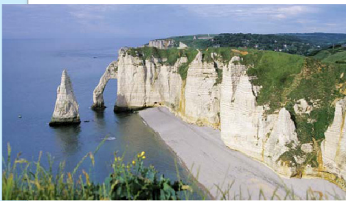
L'Arche et la falaise d'Étretat