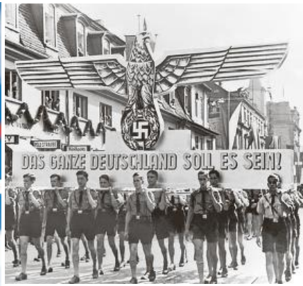
La jeunesse Hitlérienne