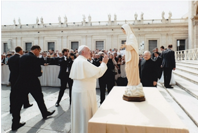
Rome : Le Pape bénit une statue de la Vierge de Medjugorje (le 17/09/14).

représentant à la célébration du 25ème anniversaire de la libération de l'Eglise grecque-catholique ukrainienne, qui aura lieu le 10 décembre prochain à Kiev.