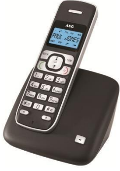
Mitsouko au CP