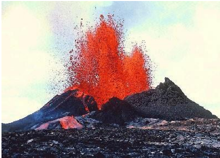
Mitsouko au CP