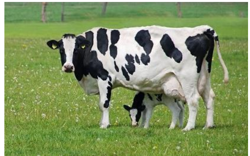
Mitsouko au CP