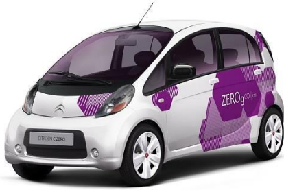
Mitsouko au CP