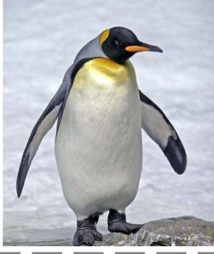
Mitsouko au CP