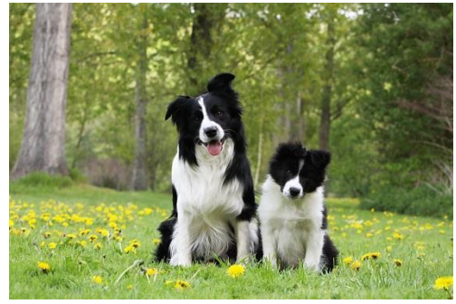
Mitsouko au CP