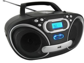
Mitsouko au CP