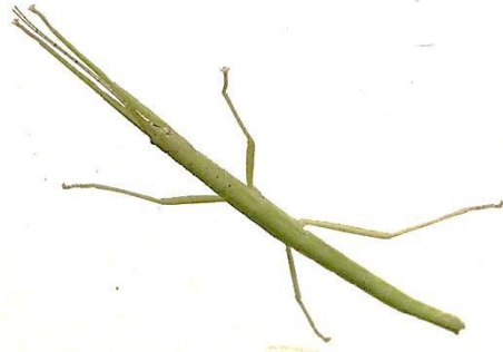
Mitsouko au CP