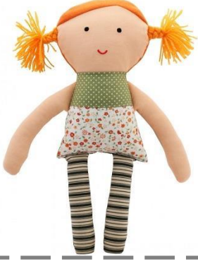
Mitsouko au CP