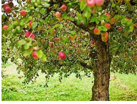
Mitsouko au CP