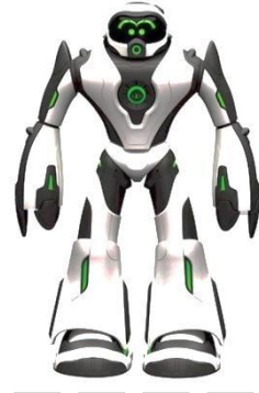
Mitsouko au CP