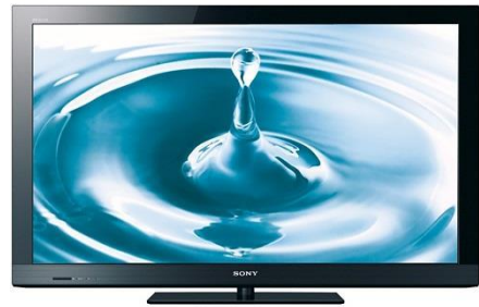
Mitsouko au CP