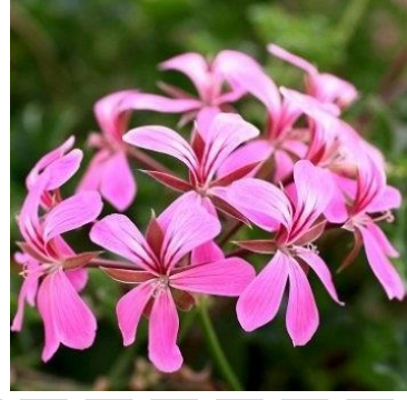
Mitsouko au CP