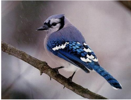
Mitsouko au CP