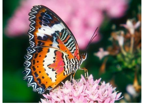
Mitsouko au CP