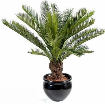
Mitsouko au CP