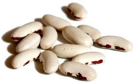
Mitsouko au CP