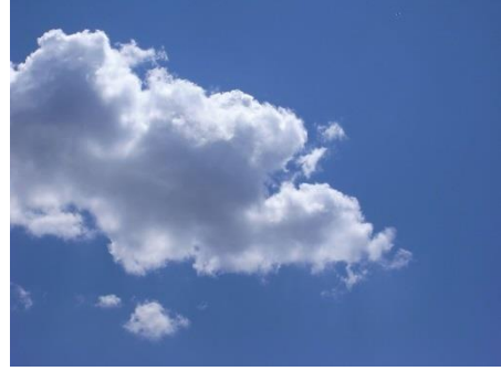
Mitsouko au CP