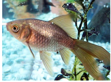
Mitsouko au CP