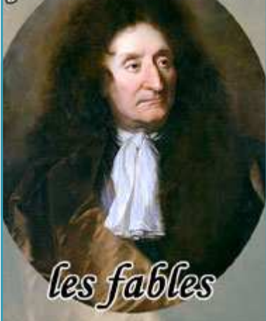
Jean de La Fontaine

Travaillez, prenez de la peine : C'est le fond qui manque le moins. Un riche laboureur, sentant sa mort prochaine, Fit venir ses enfants, leur parla sans témoins. "Gardez-vous, leur dit-il de vendre l'héritage Que nous ont laissé nos parents : Un trésor est caché dedans. Je ne sais pas l'endroit ; mais un peu de courage Vous le fera trouver : vous en viendrez à bout. Remuez votre champ dès qu'on aura fait l'août : Creusez, fouillez, bêchez ; ne laissez nulle place Ou la main ne passe et repasse." Le père mort, les fils vous retournent le champ, Deçà, delà, partout : si bien qu'au bout de l'an Il en rapporta davantage. D'argent point de caché. Mais le père fut sage De leur montrer avant sa mort, Que le travail est un trésor.