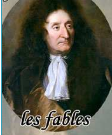
Jean de La Fontaine