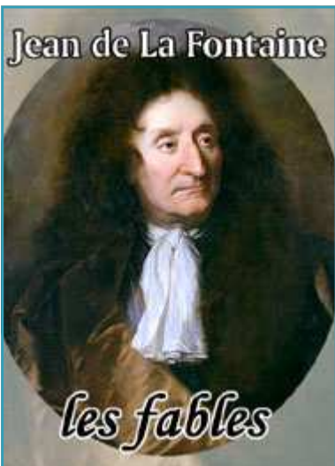
Jean de La Fontaine

Le récit en farce en fut fait, On l'appela le Pot au lait .