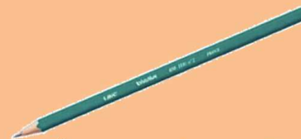
Crayon de papier