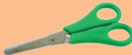
Paire de ciseaux